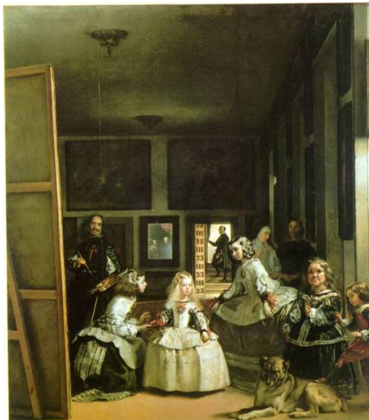
Diego Velázquez: Las Meninas