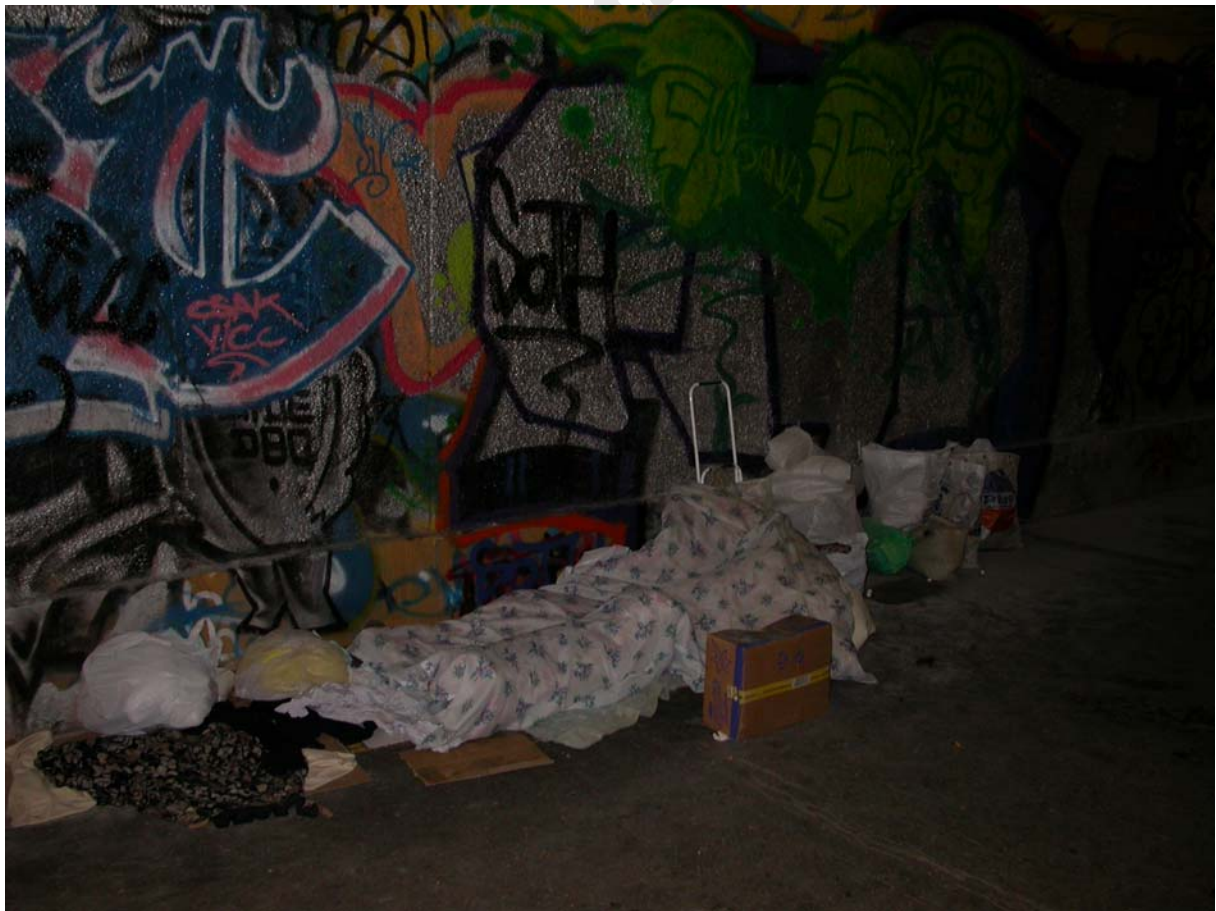
Les sans abris dans la ville

Observez la photo, commentez-la, puis exprimez votre point de vue sur cette question.